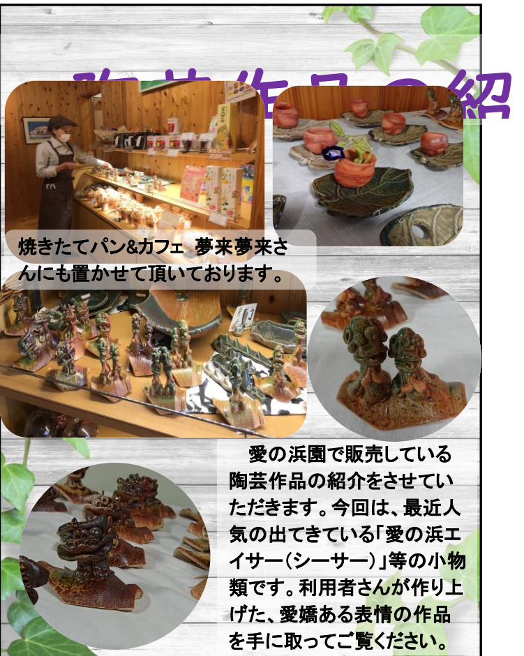
焼きたてパン&カフェ 夢来夢来さんにも置かせて頂いております。

愛の浜園で販売している陶芸作品の紹介をさせていただきます。今回は、最近人気の出てきている「愛の浜エイサー（シーサー）」等の小物類です。利用者さんが作り上げた、愛嬌ある表情の作品を手にとってご覧ください。