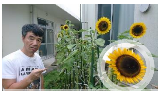
台風にも負けず、とても綺麗に咲きました。