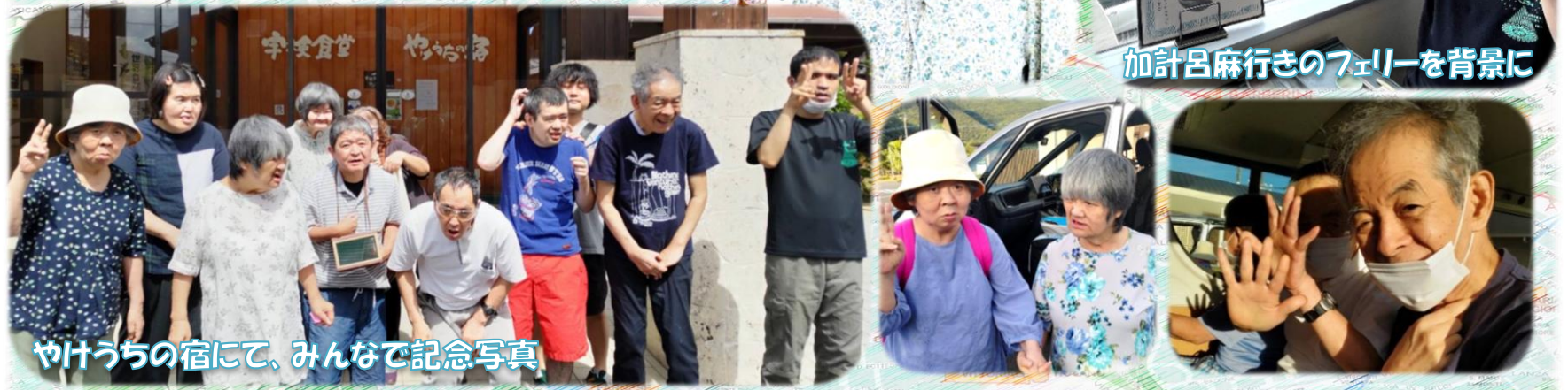
加計呂麻行きフェリーの背景に

7月13日、14日に男性利用者5名、女性利用者4名で一泊旅行を行いました。今回は宇検村やけうちの宿に宿泊しました。13日16時に園を出発し、宿に向かい美味しい夕食を頂き、14日には瀬戸内町の海の駅で豪華な昼食を頂きました。利用者の皆さんは美味しそうに食べられていました。限られた時間でゆっくりと観光はできませんでしたが、外泊、食事を楽しんでいる様子でした。(記事: 隈元)