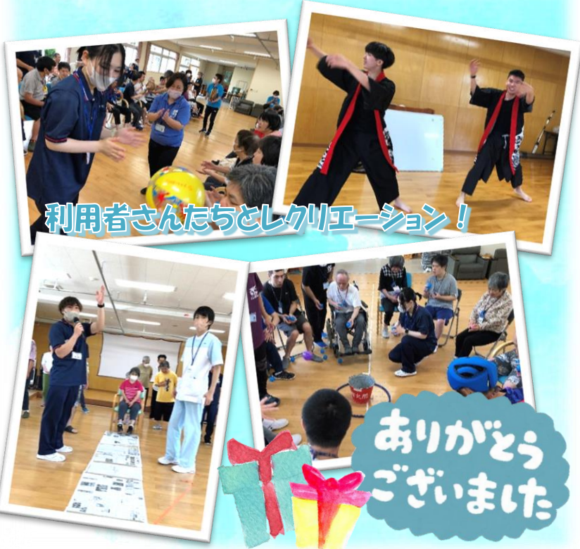
利用者さんたちとレクリエーション!

昨年の8月に、従妹の子どもが生まれました。私にとって自分の子どものように関わっていましたが、今月、奄美を離れる事になりました。1歳をお祝いしたかったのですが、とても残念です。新生児からお世話をして、沢山の成長過程が見られました。首が座ったことや寝返り、はいはい、つかまり立ちした時、ひとりで立った時、本当に感動しました。そのたくさん撮った動画を利用者さんに見せて、「可愛いね～」とお話しています。利用者の方々には赤ちゃんの動画を見て、とてもにこやかにして、嬉しそうな表情を見せて、私もほっこりしています。子どもの力はすごいと実感しました。離れるのは寂しいですが、また成長した姿に会える事を楽しみに私も奄美で元気に頑張りたいと思います。皆さんにも嬉しい事やほっこりする事がたくさん訪れますように♪(記事: 田代)